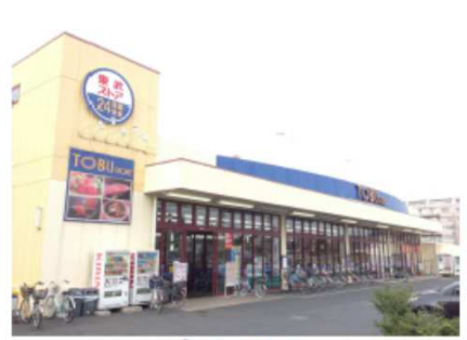
⑨東武ストア 24時間営業